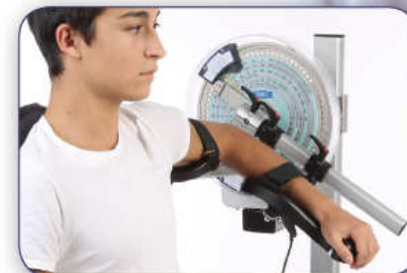
Rotazione Rotation Rotation Rotación