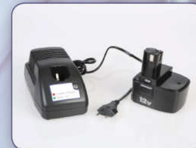
Batteries/battery charger Kit batterie/carica batterie Kit batterie et chargeur de batteries Kit de batería y cargador de baterías Set batterie und ladegerät