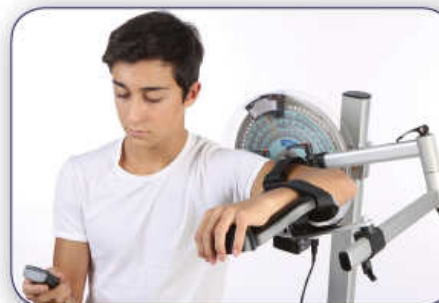
Elevazione in abduzione Elevation in abduction Anhebung in Abduktion Élévation en abduction Elevación en abducción