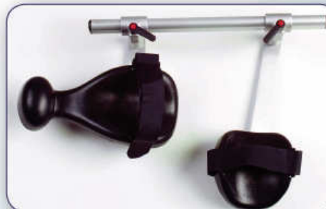
Supporto braccio per movimento di Rotazione Arm support for Rotation movement Halterung des Arms für die Rotationsbewegung Support du bras pour le mouvement de rotation Soporte brazo para el movimiento de rotación